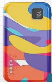
idmix | P10 Ci Pro 乙副