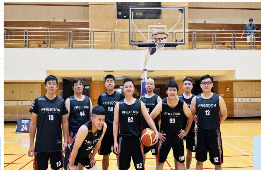
# 籃球比賽 Clubs-Basketball