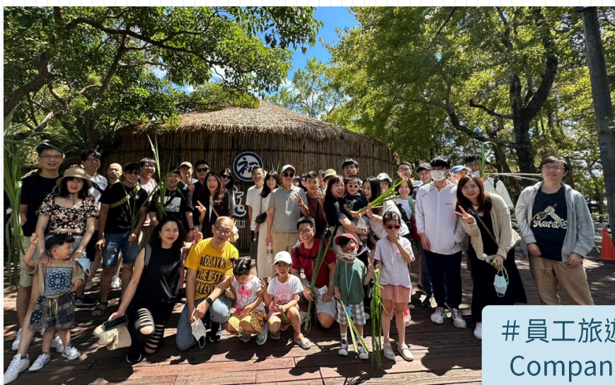
# 員工旅遊 Company Trip