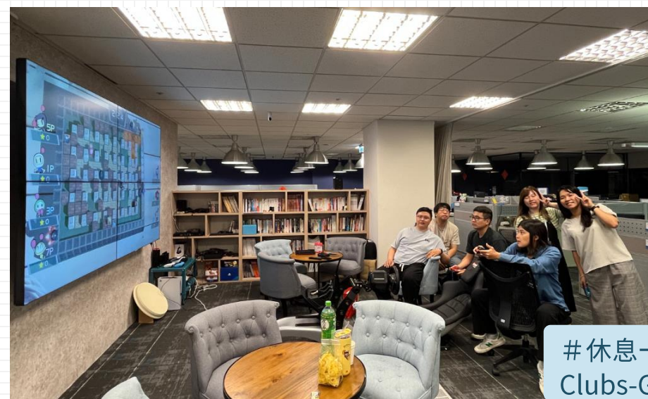
#休息一下，打場遊戲 Clubs-Gaming