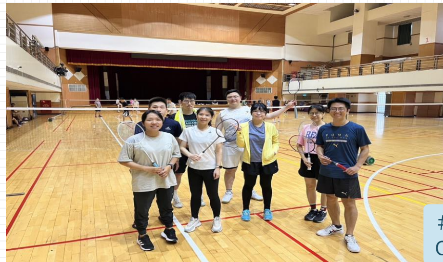
# 多元社團活動 Clubs-Badminton