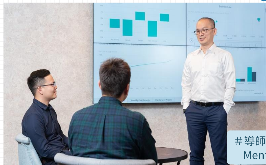
# 導師制有問必答 Mentorship