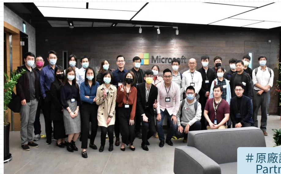
# 原廠訓練支持 Partner Resource