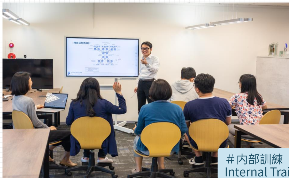
# 內部訓練 Internal Training