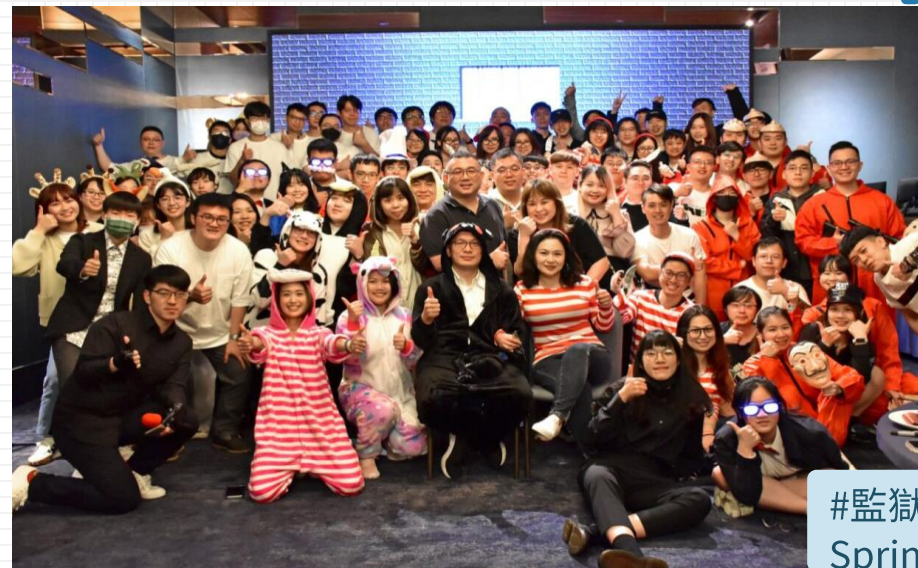
#監獄主題春酒 Spring Party