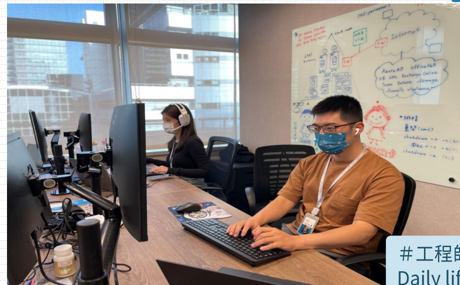
#工程師的日常 Daily life