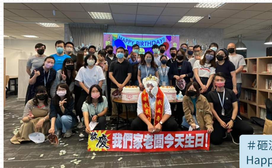
#砸派不手軟🍰 Happy Birthday