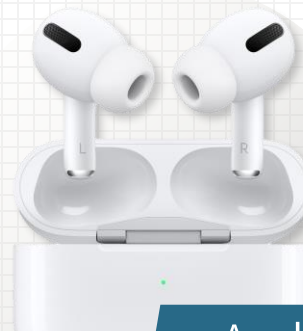
Apple Air Pods Pro 2 乙副