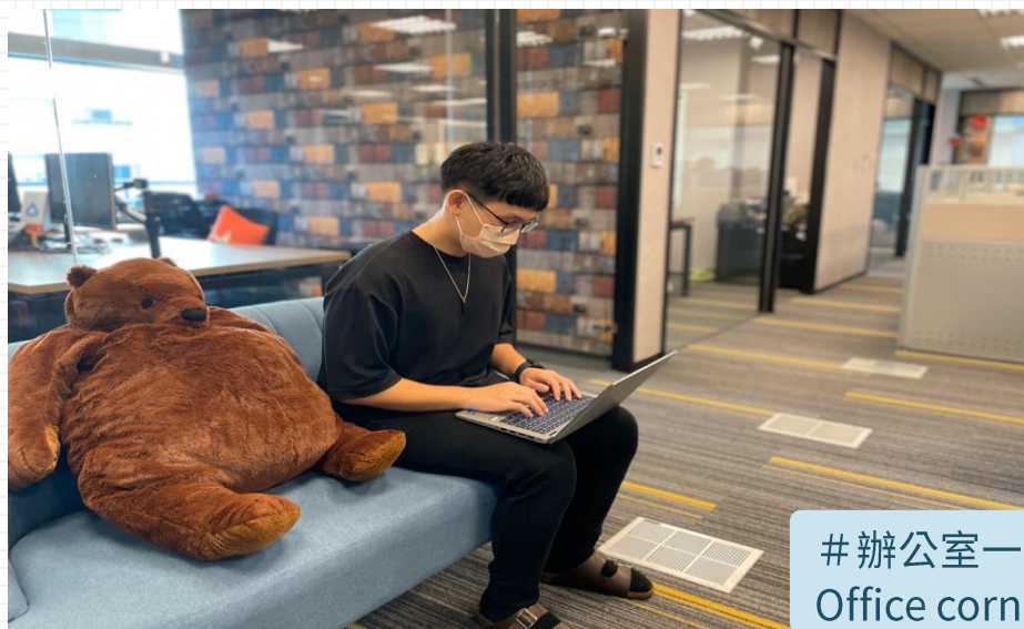
#辦公室一角 Office corner